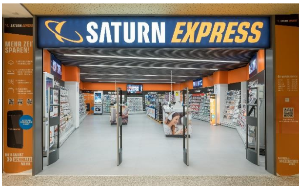
Saturn Express ist der erste kassa-freie Store in Europa und verbindet damit die Kernkompetenzen des Handels mit den Vorteilen des Online-Einkaufs.